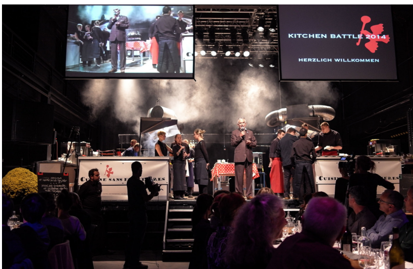
Auf der Bühne am Kitchen Battle.