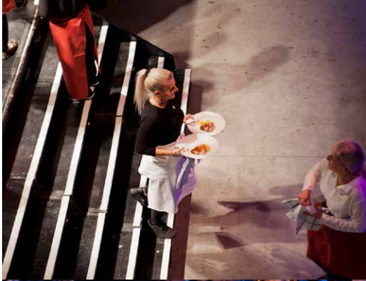
KITCHEN BATTLE ZÜRICH SEIT 2009